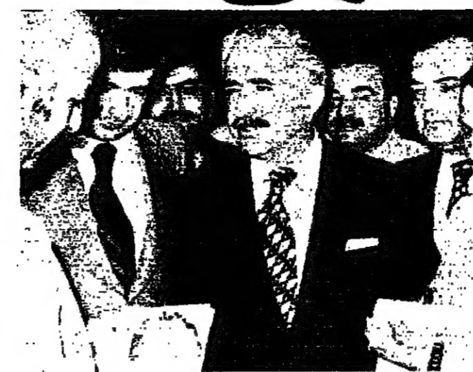
الرئيس كراي يتحدث الى الصحفيين في القصر الجمهوري